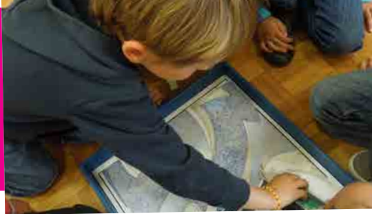
Visite au musée des beaux-arts de Rennes : puzzle autour des Bleus mouvants de Frantisek Kupka.